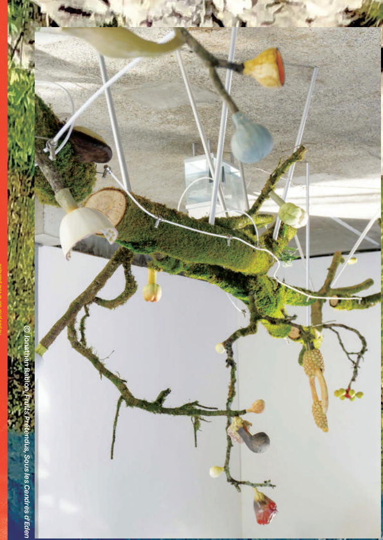
© Jonathan Bablon, Photos Prêtendus, Sous les Cendres d'Eden