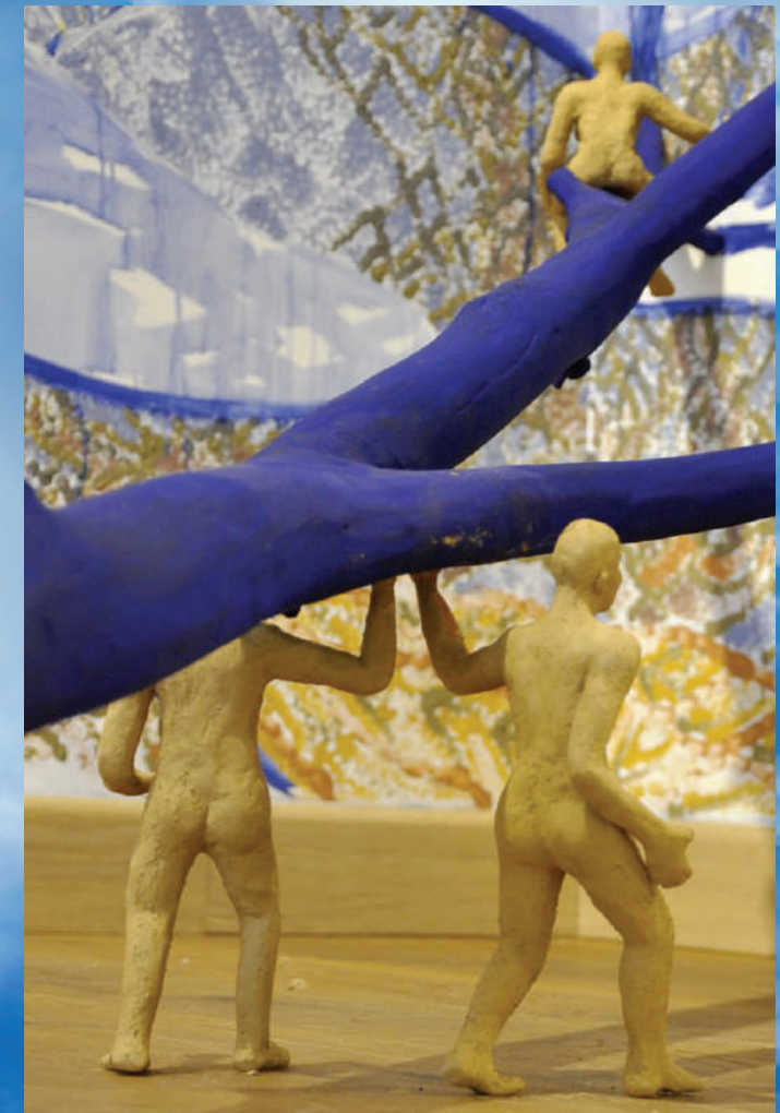
© Ugo Lange, Entendez-vous rêver la Terre ?, Benjamin Bloch, Hugo Carton, Ugo Lange