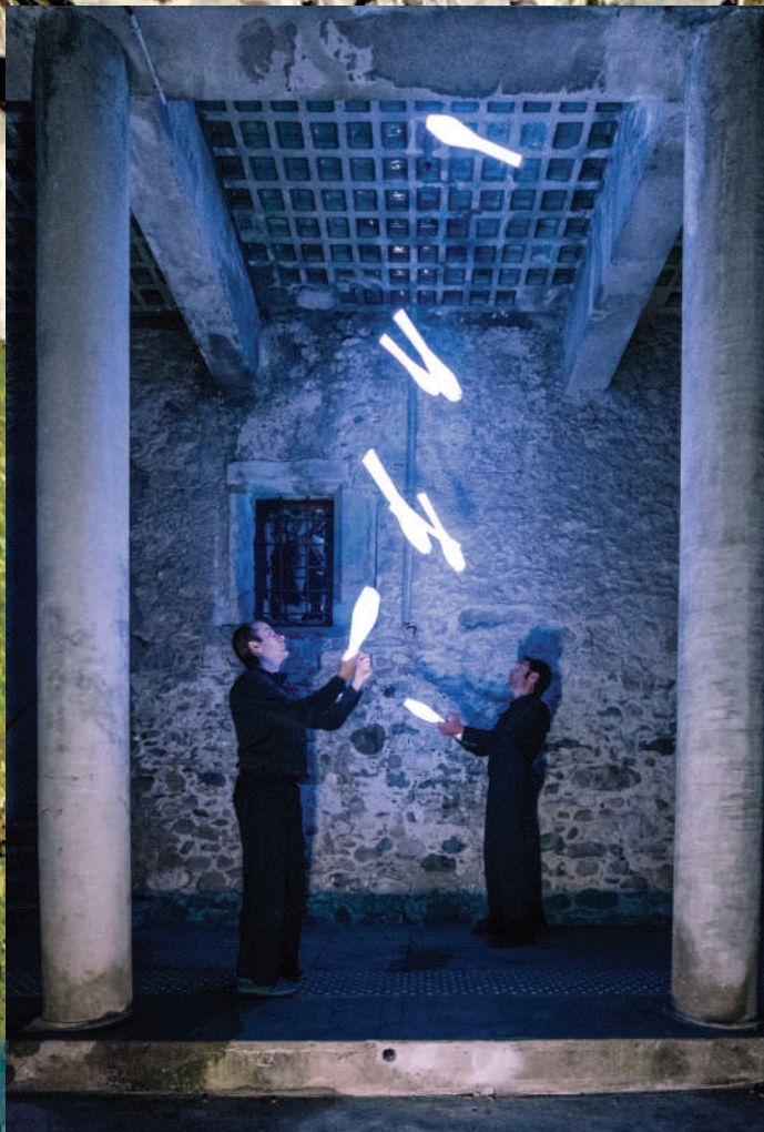
© Cie des Naz, Light Sellers