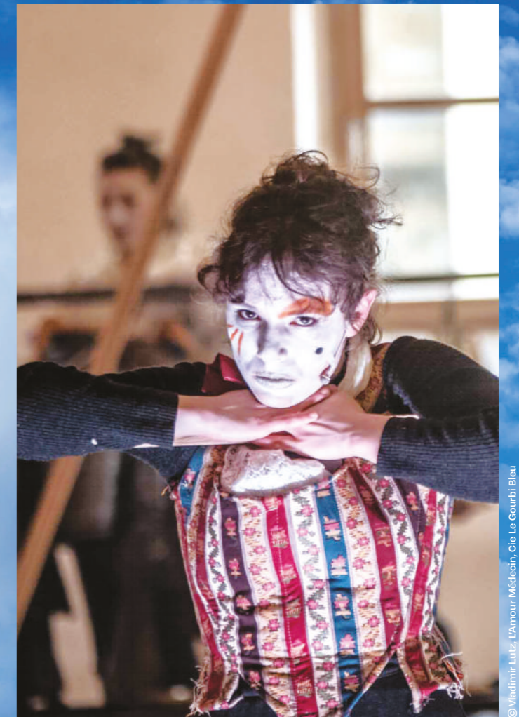
© Vladimir Lutz. L'Amour Médecin, Cie Le Gourbi Bleu