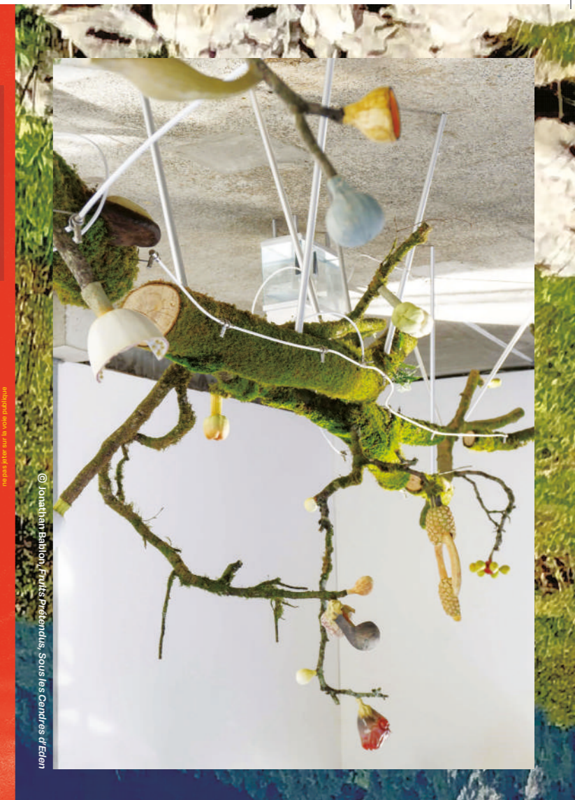
© Jonathan Bablon, Frits Préterius, Sous les Cendres d'Iden