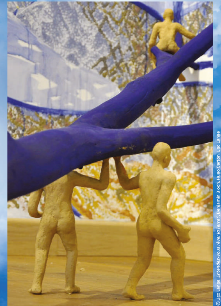
© Ugo Lange. Entendez-vous rêver la Terre?, Benjamin Bloch, Hugo Canton, Ugo Lange